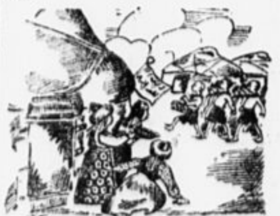
Комсомольцы или пионеры.

А пока они издали наблюдают за играми и маршировкой пионеров, не решаясь подойти ближе.