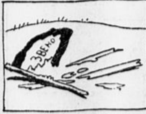
РВУТ НА ЧАСТИ... ДИСЦИПЛИНУ.

Очевидно, через три года будет 100-процентное шефство. Не раньше.